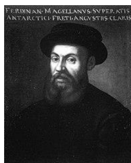
Vasco da Gama